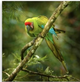
Great Green Macaw